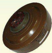
Противопехотные и противотанковые мины

Взрывоопасные предметы, имеющие схожий вид с оружием/боеприпасами своего типа