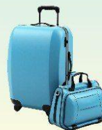
Сумки и чемоданы