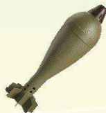
Артиллерийские снаряды и авиационные бомбы